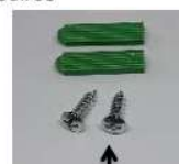
Cheville et vis fixation murale (voir patron fixation fourni)